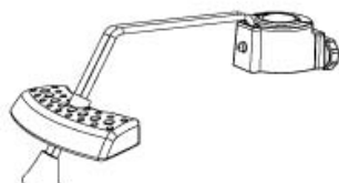
Подножка с подпятником фиксирующимся в пол