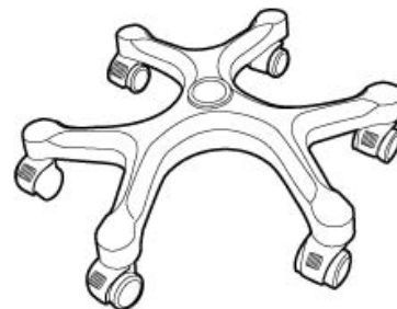
Шестилучевая крестовина с фиксируемыми колёсами