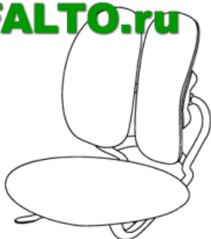
Кресло Duorest KIDS MAX